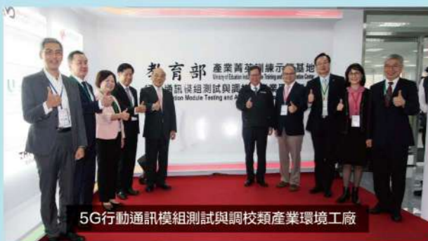
5G行動通訊模組測試與調校類產業環境工廠